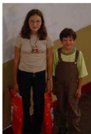
Bon c'est pas tout, mais on rentre comment ? c'est lourd ces trucs qu'on a gagné !