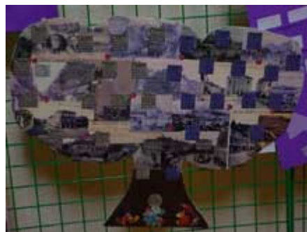
un arbre dans la forêt