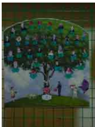
si on s'coue, qui est-ce qui va tomber ?