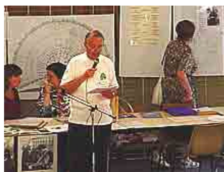
Le Président : "...euh..."