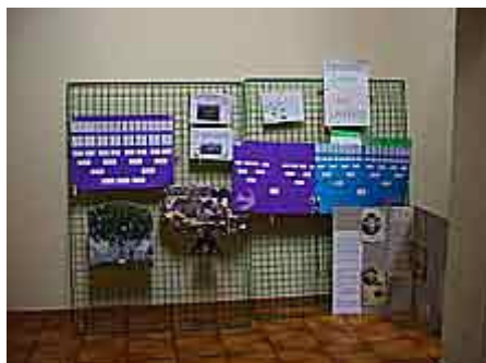
une forêt d'arbres